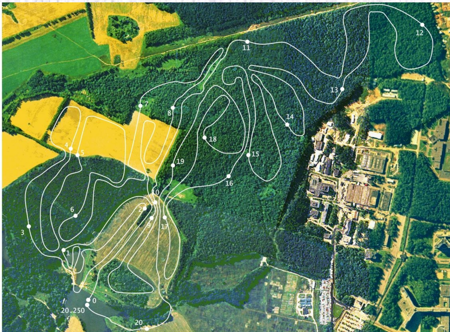
Схема и профиль лыжных трасс в зоне отдыха “Битца”